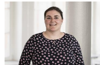
Roland Schneider/ Bilderraum Fotostudio