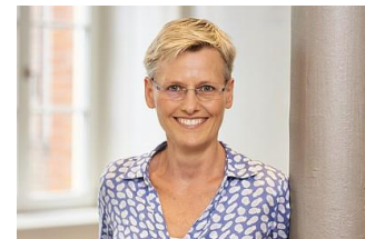
Roland Schneider/ Bilderraum Fotostudio