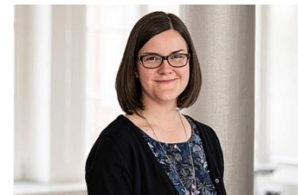
Roland Schneider/ Bilderraum Fotostudio